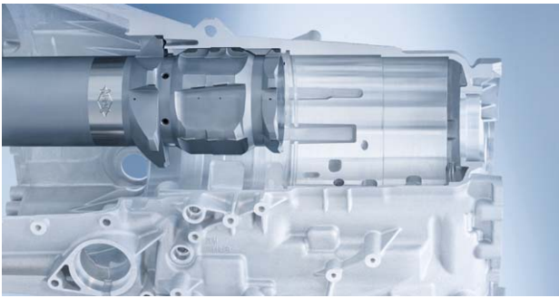
Bild 2: Modernste Technologien lassen Werkzeuglösungen entstehen, welche vor wenigen Jahren noch undenkbar gewesen wären.

de vollzogen. Diese bahnbrechenden Innovationen wurden von Mapal konsequent verfolgt und bereits mehrfach im Serienbetrieb erfolgreich umgesetzt. Komplettbearbeitungen von Messingbauteilen mit entsprechender Geometrie am mehrschneidigen PKD-Werkzeug erzielen Resultate, die alles bis dato Bekannte übertreffen. Daneben müssen an dieser Stelle auch die Marktchancen im Bereich der Aluminiumzerspanung, insbesondere im Bereich Automotive, betrachtet werden. Nicht immer ist die Investition in ein Bearbeitungszentrum für