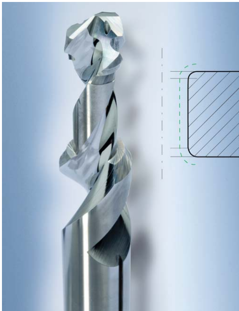
Bild 3: Das Kombinationswerkzeug bearbeitet die Bohrung beidseitig mit einer eng tolerierten Formsenkung.

tät. Gleichzeitig kann auch der Vorschub um ca. 25 % gesteigert werden. Die Hauptzeit beim Bohren lässt sich damit also um 60–70 % reduzieren.