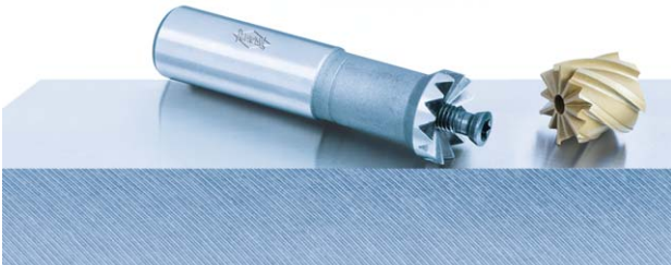
Bild 6: Zum Schlichtfräsen von Titan wird ein Wechselkopf-Fräser mit TTS-Schnittstelle eingesetzt.

und weist hohe Anforderungen an Qualität und Standzeit auf. Mapal setzt für die Bearbeitung Vollhartmetall-Bohrsenker mit Diamantbeschichtung ein. Mit dem Werkzeug werden Rattermarken an der Senkung und Delamination am Austritt verhindert. Höchste Genauigkeiten werden erreicht ( Bild 5 ).